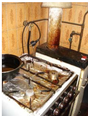
Afb. 1 pand tijdens 1 e controle Inhaalslag

Tevens blijkt uit de resultaten dat de controles van uitkeringsgerechtigden op basis van het bezoeken van panden veel informatie oplevert. Bij 11,6% van de gecontroleerde uitkeringsgerechtigden wordt nadere actie ondernomen. 71 uitkeringen zijn beëindigd, hetgeen een aanzienlijke besparing oplevert.